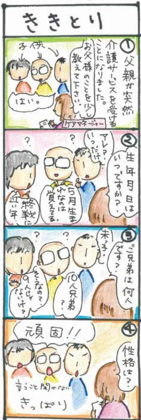
のほほんコバちゃん